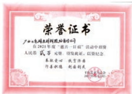
「慈善一日捐」活動 捐資人民幣二萬元