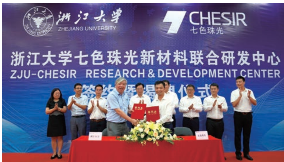
「浙江大學七色珠光新材料聯合研發中心」簽約及揭牌儀式

本集團遵循自然規律探尋色彩的本質，用科技的力量，將色彩數字化。經不斷探索與研發，本集團研製出主要以天然雲母，人工合成雲母，玻璃鱗片，氧化矽四種基材為主的珠光顏料產品。