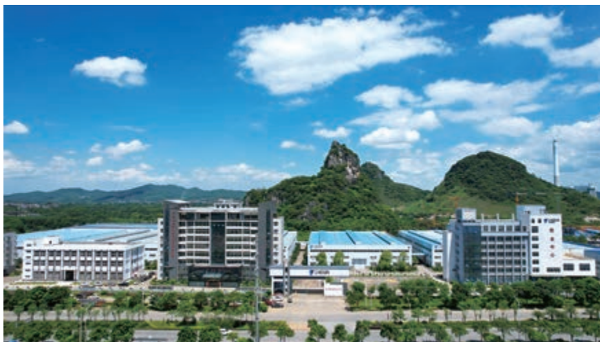
屋頂分散式光伏項目

隨著社會進步和經濟發展，全球能源轉型趨勢明顯，太陽能作為一種集「清潔、無污染、無排放、取之不盡、用之不竭」，因此於本集團正積極籌備屋頂分散式光伏項目，在本集團約2.7萬平方米的廣西生產設施屋頂，安裝總容量約為峰值達2.7兆瓦的光伏分散式發電組件，此項目預期在二零二二年二月將會正式啟動，本集團把可再生能源併入生產設施區域內電網，在節能減排上可起到顯著的作用。同時，生產設施上鋪設光伏元件，可有效保護屋面不受日曬雨淋，延長生產設施屋面使用壽命，降低生產設施的使用和維修成本；光伏發電時段與用電高峰時段較一致，能起到一定的削峰作用，有效緩解用電緊張時生產設施的供電壓力，保障生產設施的正常生產活動。由於光伏元件吸收太陽輻射，可有效降低室內溫度3-5度，從而改善車間工作環境，減少夏天降溫成本。本集團屋頂分散式光伏項目的建設，可有效利用太陽能能源，減少環境污染，改善生態環境，促進環境經濟可持續發展，同時助力企業綠色、高效、可持續發展，對社會和企業都將帶來利好。