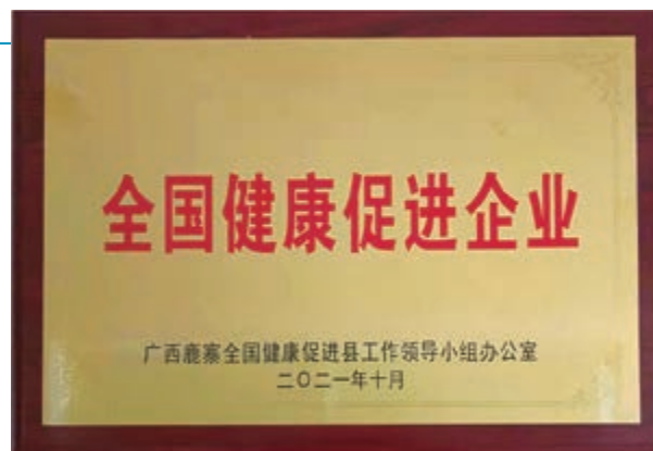
全國健康促進企業

僱員的健康對本集團至關重要。本集團並承諾為其僱員提供安全工作環境。為維護安全的工作環境並減少潛在的工傷事故，本集團已制定安全管理內部政策，致令不同團隊均獲分配不同安全合規責任。本集團對僱員在工作場所進行人身攻擊、威脅行為、不受歡迎的拍照和騷擾行為採零容忍態度。本集團已經獲得ISO 9001:2015、ISO 14001:2015和ISO 45001:2018證書。於二零二一年財政年度期間，我們被評為「柳州市健康企業」，同時被「廣西鹿寨全國健康促進縣工作領導小組辦公室」評為「全國健康促進企業」及被「鹿寨縣衛生健康局」評為「鹿寨縣2021職業健康管理狀況A級企業」之一。