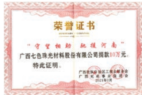
「馳援河南」 捐款人民幣十萬元